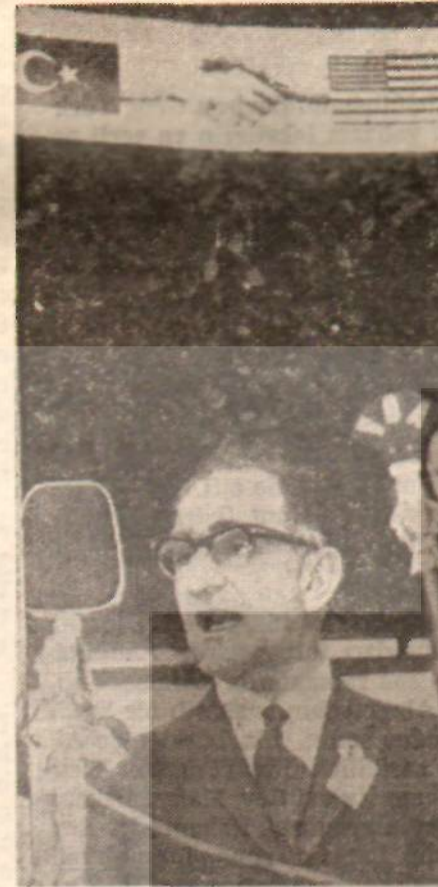
Danış Koper İşten el çektilerimdir!

YONAYON NOTU: Komisyon çalışmalarında üyelerden Rüşti Özal müteahhidi Süleyman Demirel'in inşaatındaki metre-kare maliyet