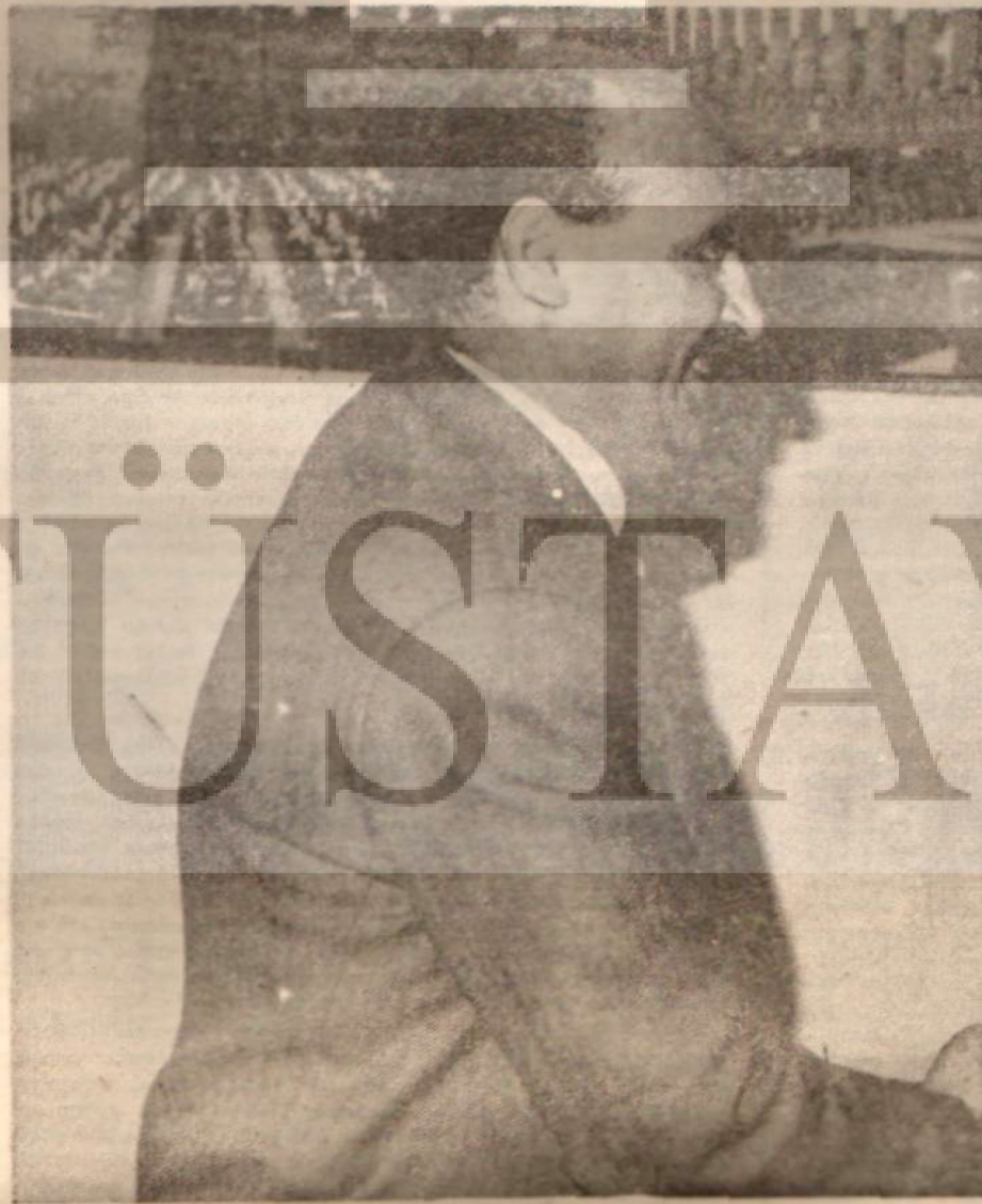
Süleyman Demirel Morrison Temsilcisi