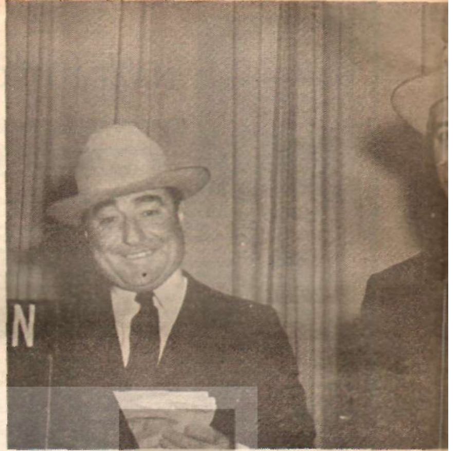
Adnan Menderes ve onun Dışişleri Bakanı Fatin Rüştü Z Tesadüfen mi «Mösyö % 10» dediler?

Osmanlı Bankası ve Deutsche Bank'a sırtını dayayan «Ulu Hakan» işte böyle bir rüşvet sistemi kuran adamdır. Savunucuları, onun çok usta bir diplomat olduğunu, emperyalist devletleri birbirine düşürerek, Osmanlı İmparatorluğunun parçalanmasını uzun süre geciktirdiğini ileri sürerler. Bu iddia da bir yakıştırma ibarettir. Abdülhamidin komprador, ya da bezirgân diplomasisinden yararlanan