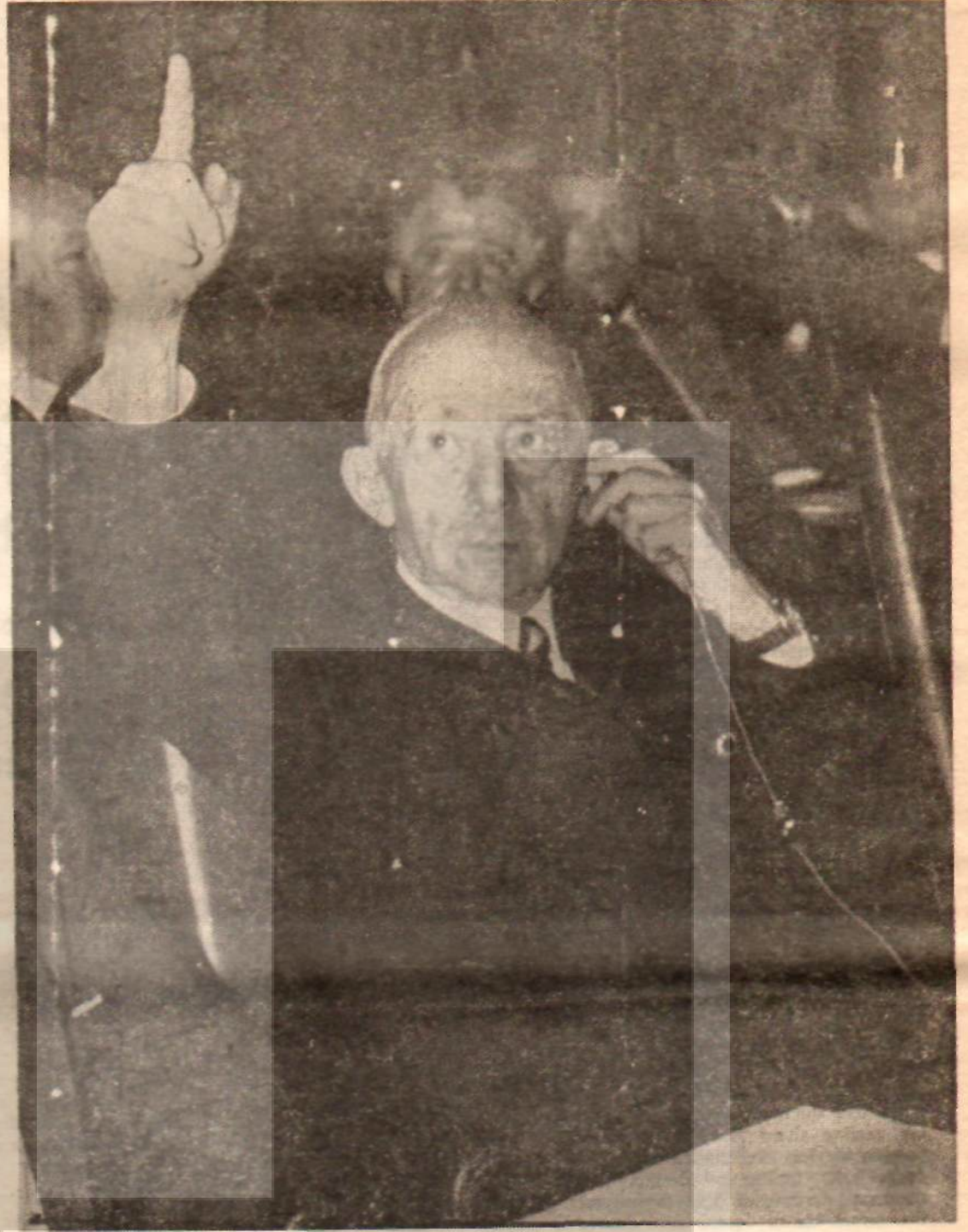
C.H.P. Genel Başkanı İsmet İnönü «Lütfen dinler misiniz?»